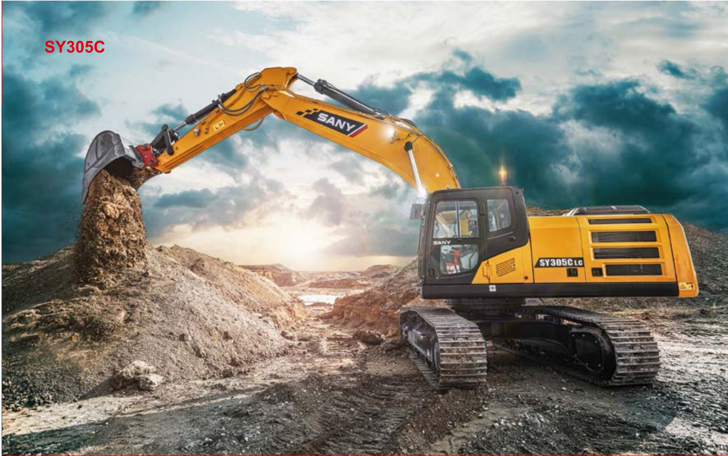
SY305C נתונים עיקריים