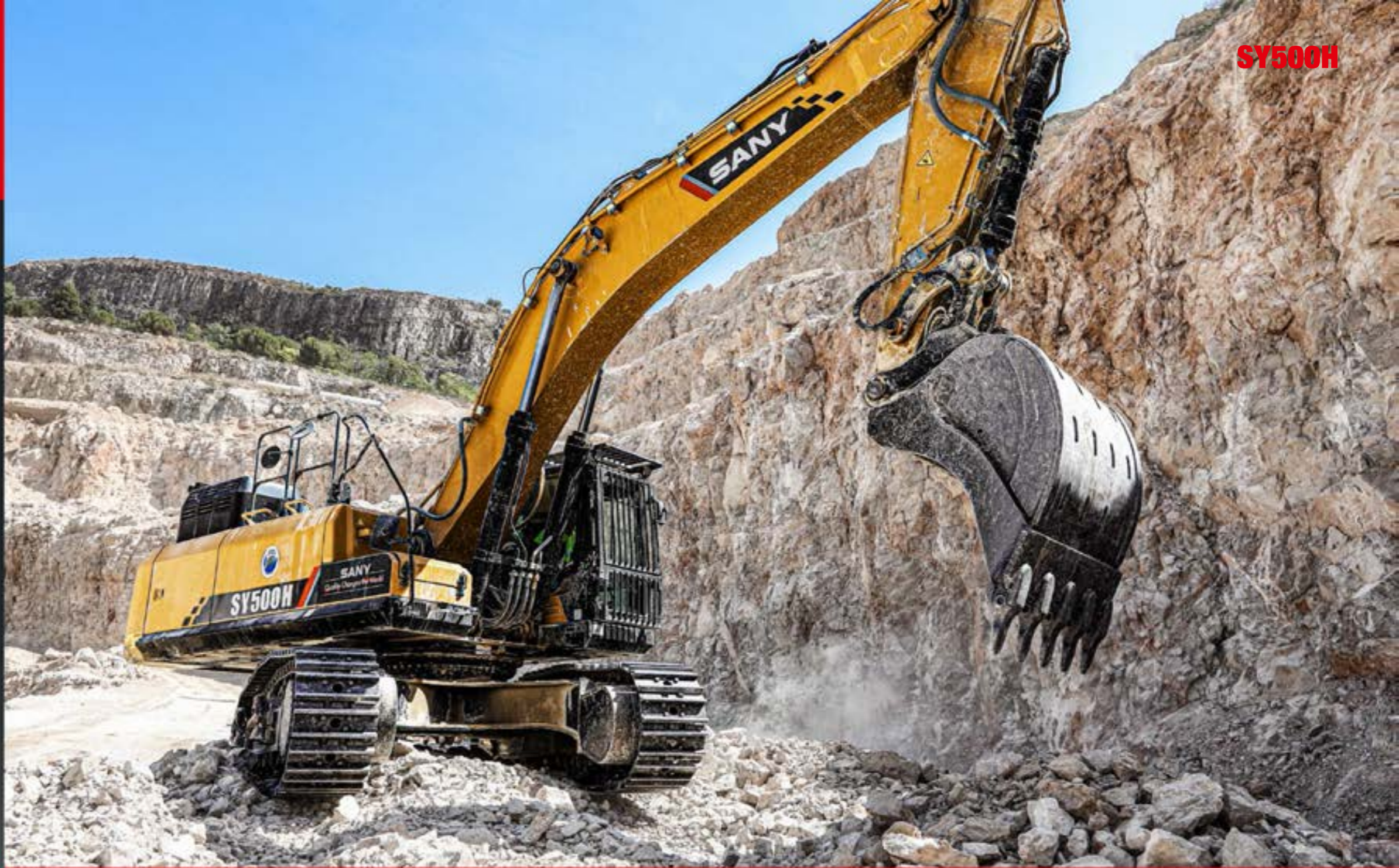
SY500H נתונים עיקריים

* ישים עבור שווקים מסוימים, בדוק עם מרכז השיווק והשירות המקומי שלך